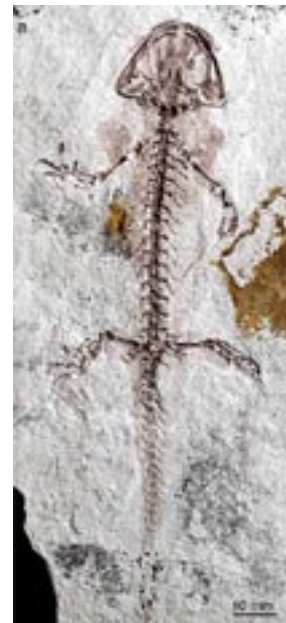
(Mick Ellison et Kalliopi Monoyios)

Bien qu'ayant survécu à des périodes d'extinction massive, les salamandres sont aujourd'hui menacées, comme les autres amphibiens. Pour différentes raisons - maladies, climat, pollution- les populations d'amphibiens sont en déclin sur l'ensemble de la planète.